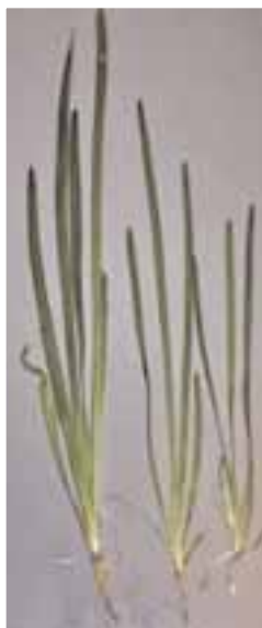
Vallisneria americana (natans) (Tropica No. 055)

Bladene er smale (opp til 10 mm brede) og båndformede, middels lange (50-100 cm) og med 3-5 langsgående nerver. Tverrgående nerver er tilfeldig spredt over bladene. Planten kommer fra det sydøstlige Asia, hvor den vokser i store bestander i både stillestående og strømmende vand. Det er en enkel og fordringsløs begynnnerplante som ikke stiller spesielle krav til hverken lys eller CO 2 , og som kan klare et bredt temperaturintervall (18-28 °C). Den formeres lett via utløpere.