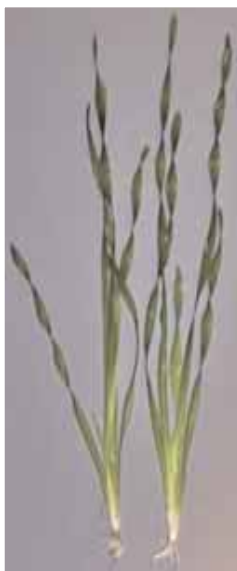
Vallisneria americana var. biwaensis (Tropica No. 056)