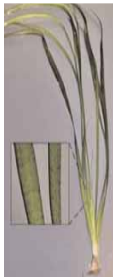
Vallisneria spiralis "Tiger" (Tropica No. 055A)