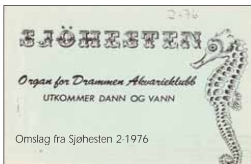
Omslag fra Sjøhesten 2-1976